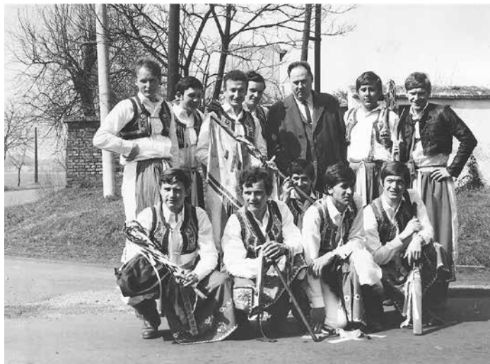
U farní zahrady