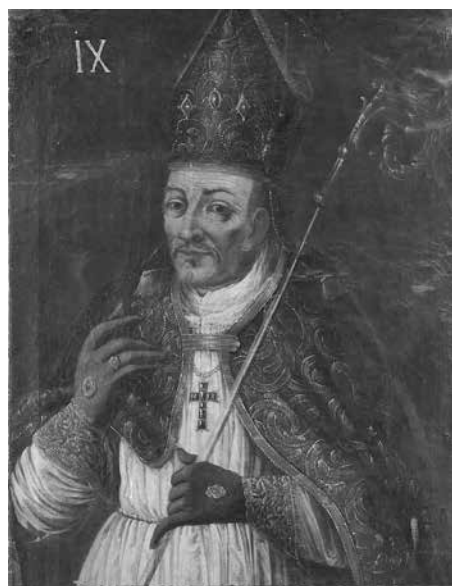
JINDŘICH ZDÍK - MUZEUM UMĚNÍ OLOMOUC, REPROFOTO ZDENĚK SODOMA

Jejich přehled sepsal „ ve jménu svaté a nerozdílné Trojice. Jindřich z Boží milosti biskup olomouckého kostela všem pravověrným synům katolické církve “ v tzv. translační listině pravděpodobně mezi lety 1136 - 1141. Ta je pro Ratiškovice nejstarší známou písemnou zmín- kou o obci. Protože předchází pri- vilegia olomouckého kostela „ byla z části ztrávena stáří a s části ztracena za válečných zmatků “, chtěl zaznamenat v této listině